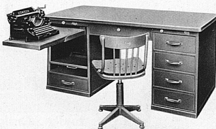
Beispiel eines kombinierten Bigla-Stahlpultes mit Schreibmaschinen-Versenktisch

BIGLA-Fabrikate sind Schweizer Qualitätsarbeit