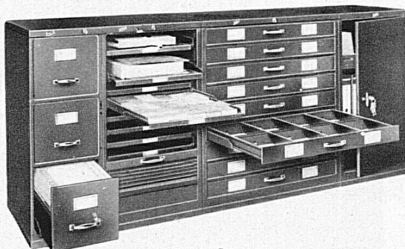
Beispiel einer kombinierten 111,6 cm hohen Anlage

ist geeignetes Mobiliar die unentbehrliche Voraussetzung für rationelle Gestaltung und reibungslose Abwicklung der Arbeit. Bigla-Stahlmöbel sind unter diesem Gesichtspunkt und auf Grund langjähriger Erfahrung hergestellt. Hunderte von Firmen verschiedenster Art und Grösse, die heute Bigla-Stahlmöbel verwenden, werden Ihnen bestätigen, dass sie damit zufrieden sind. Verlangen Sie unverbindliche Zusendung unseres Kataloges.