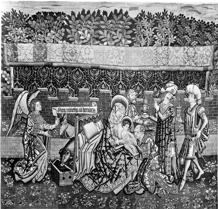
Tapisserie des Trois Rois, haute-lisse flamande, provenant également du Trésor de la Cathédrale de Lausanne (Musée historique de Berne)

Pour se payer des peines qu'ils avaient prises en apportant au Pays de Vaud les baillis et la Réforme, nos amis de Berne eurent la bonne idée d'emballer dans leurs 18 fourgons le trésor de la Cathédrale de Lausanne, qui devenait inutile aux Vaudois, puisque ceux-ci ne connaîtraient désormais qu'un culte sans vases et sans images, et qui présentait au surplus pour ces novices réformés certains dangers de retomber à l'idolâtrie ou dans le regret des bons temps de la Savoie.