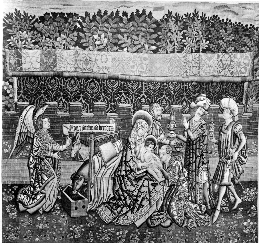
Tapisserie des Trois Rois, haute-lisse flamande, provenant également du Trésor de la Cathédrale de Lausanne (Musée historique de Berne)

Pour se payer des peines qu'ils avaient prises en apportant au Pays de Vaud les baillis et la Réforme, nos amis de Berne eurent la bonne idée d'emballer dans leurs 18 fourgons le trésor de la Cathédrale de Lausanne, qui devenait inutile aux Vaudois, puisque ceux-ci ne connaîtraient désormais qu'un culte sans vases et sans images, et qui présentait au surplus pour ces novices réformés certains dangers de retomber à l'idolâtrie ou dans le regret des bons temps de la Savoie. Ils emportèrent donc dans le lot, outre une opulente et copieuse vaisselle sacrée, les quatre étonnantes tapisseries flamandes dites de César, qui, l'on ne sait trop comment, avaient passé de la garde-robe du fameux comte de St-Pol, décapité pour haute trahison le 14 décembre 1475 à Paris, dans le mobilier du chapitre de Lausanne, où noblement elles pendaient au-dessus des anciennes stalles. La légende, qui ne peut se tenir de rattacher toujours le beau au tragique, a longtemps répandu que ces tapisseries auraient orné l'un des pavillons ducaux que Charles-le-Téméraire avait si imprudemment installés sous Grandson ou devant Morat, et que nos vachers suisses avaient chaque fois joyeusement pillés. Belle aubaine pour nos musées suisses qui plus tard ont recueilli ce butin, et pour la Suisse en général qui puisa pour la première fois dans cette précieuse garde-robe l'idée du luxe et le goût de l'art. Le Musée historique de Berne conserve en son rayon de tapisseries pas mal de ces trophées bour-