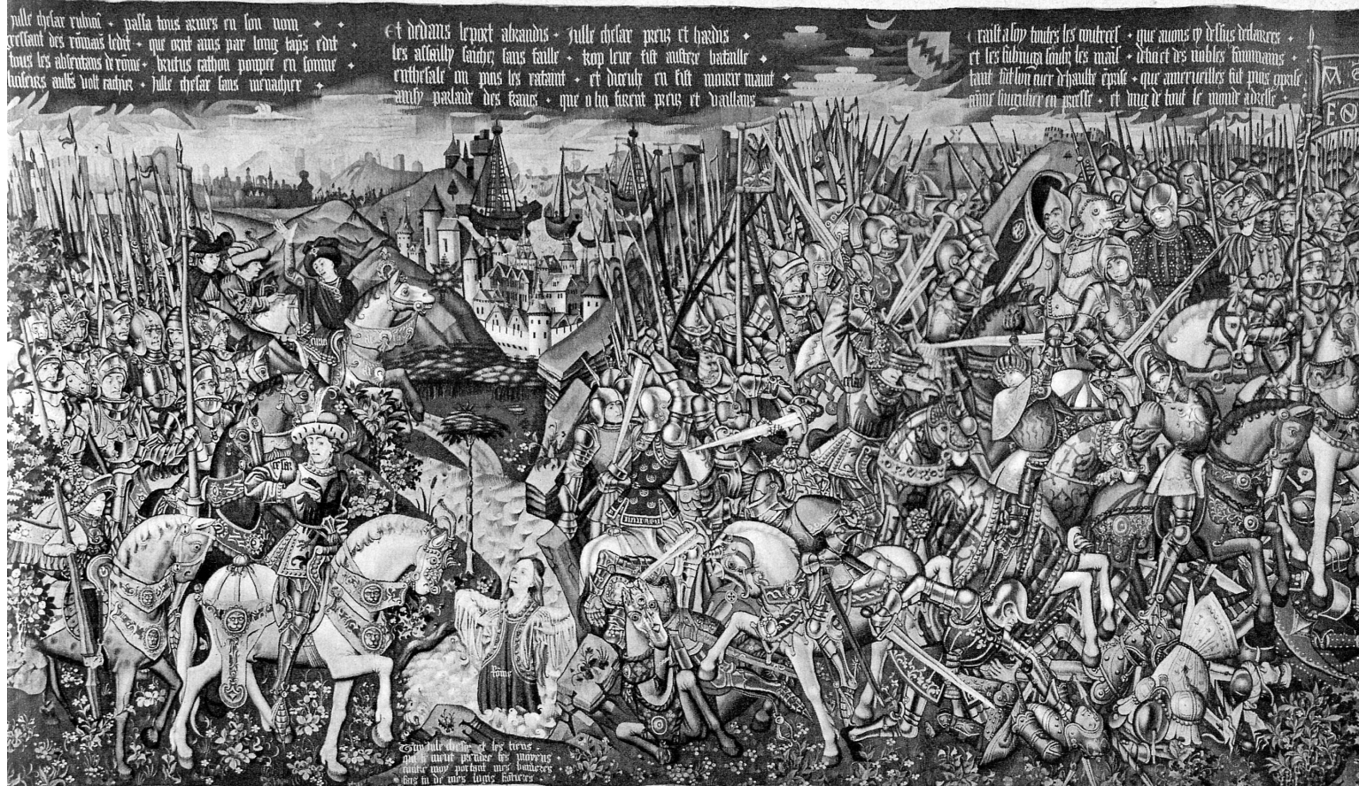
L'une des quatre Tapisseries flamandes dites de César enlevées en 1537 à la Cathédrale de Lausanne et conservées au Musée historique de Berne (à gauche, César passant le Rubicon; à droite, la bataille de Pharsale)