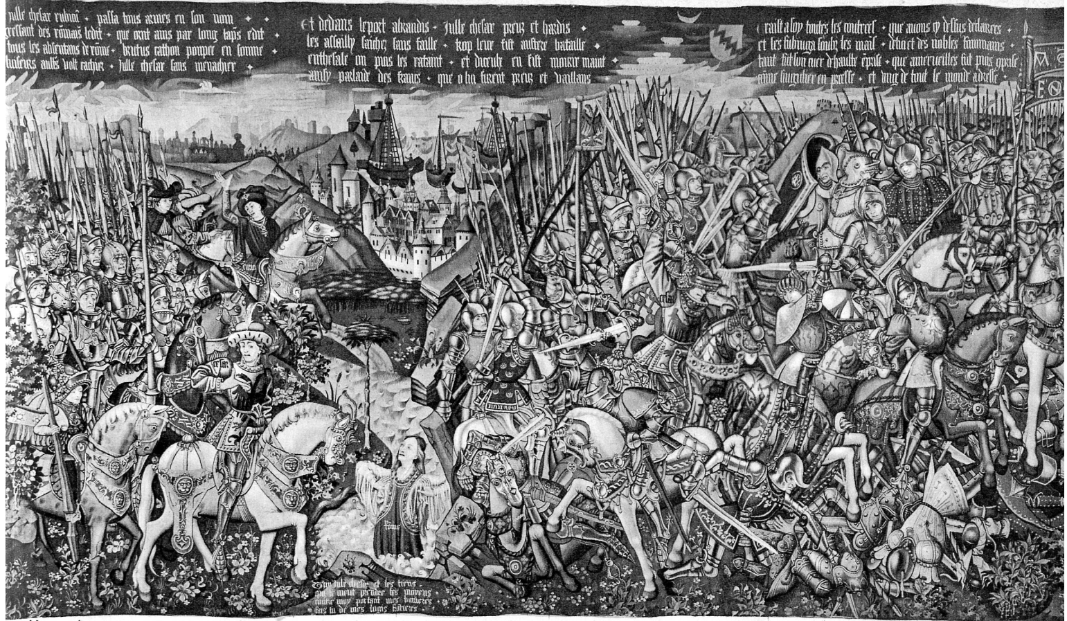
L'une des quatre Tapisseries flamandes dites de César enlevées en 1537 à la Cathédrale de Lausanne et conservées au Musée historique de Berne (à gauche, César passant le Rubicon; à droite, la bataille de Pharsale)