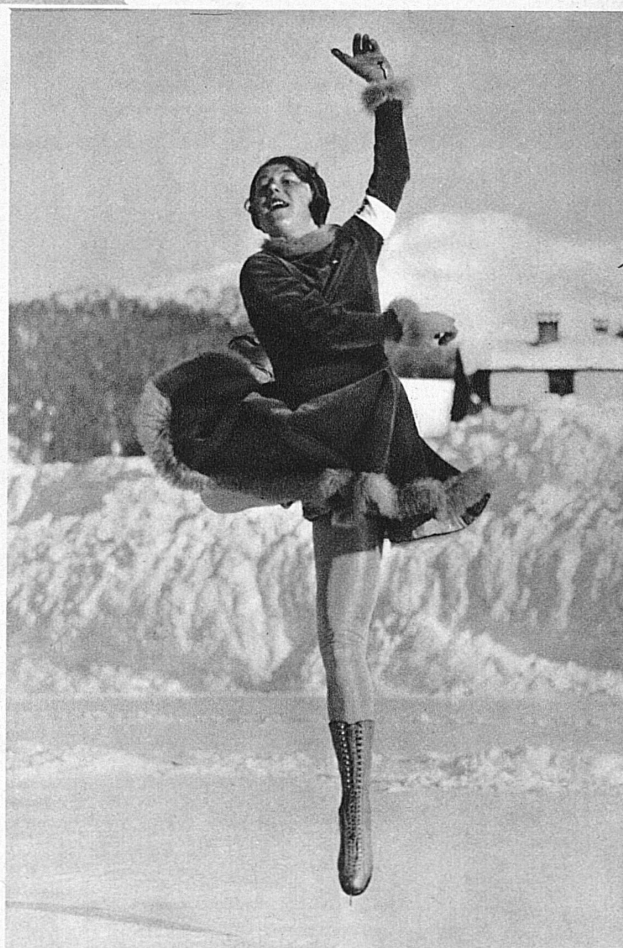
Sonia Henje, l'étoile des glaces