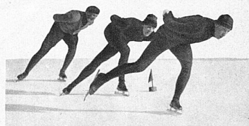
Les bolides du skating