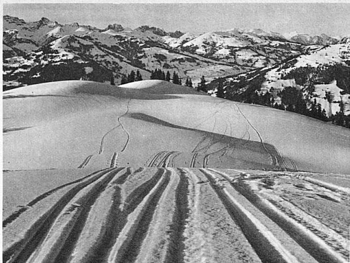
La fameuse descente en gradins de Windspillen près Gstaad