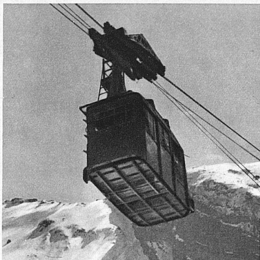
Dernier fil qui relie le monde de la brume au monde du soleil, le téléphérique se joue de l'avalanche et des cataractes de neige