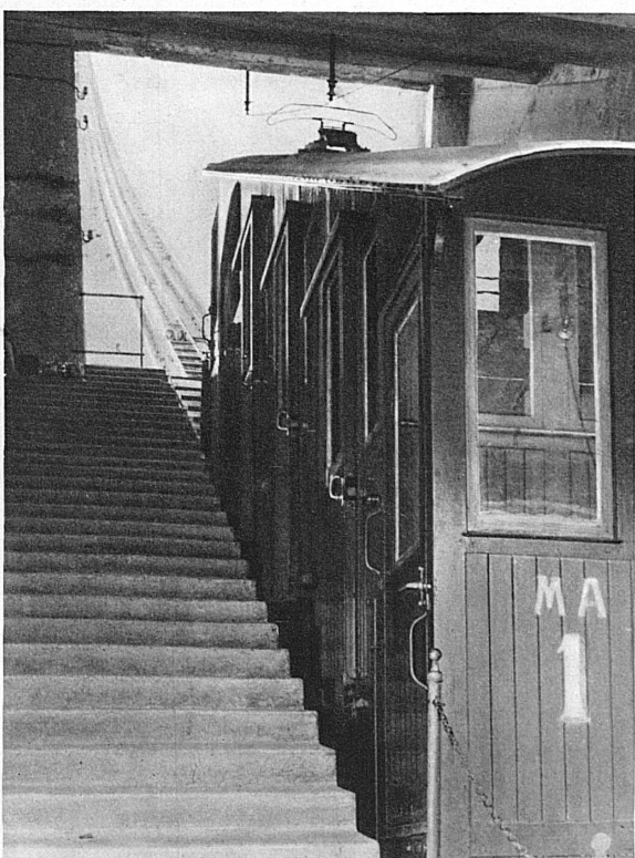
Un quart d'heure dans cette petite boîte-là, et vous serez au faite des descentes de l'Allmendhubel sur Mürren