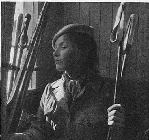
En route vers le soleil...