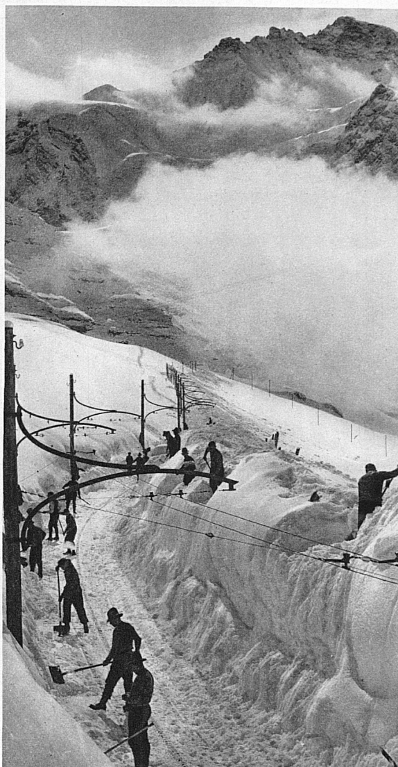
Chaque jour le vent de la nuit comblant la tranchée de la veille, chaque jour les déblayeurs doivent refaire le lit du convoi