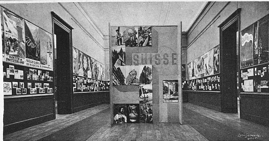
Les panneaux de l'ONST dans l'Exposition „Graphique touristique“ du Musée Rath, à Genève Die Abteilung der Verkehrszentrale an der Ausstellung „Touristische Graphik“ im Musée Rath in Genf