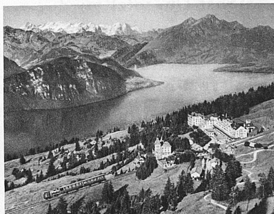
Rigi-Kaltbad mit Pilatus und Berner Alpen

Platzbelegung auch durch sämtliche patentierten Reisebureaux