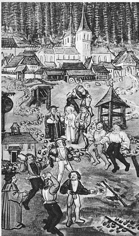
Schwingen, Steinstossen und Weitsprung bei den alten Eidgenossen. Aus der Chronik des Luzerner-Schilling