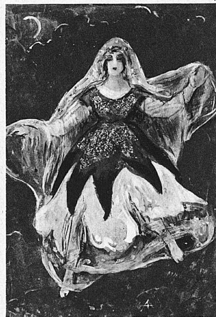
Zwei Kostüme von A. Cingria