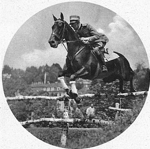
Ein schöner Sprung

Reitertage sind Festtage für Mann und Pferd — und für elegante Frauen, die bei solchen Anlässen nie fehlen. Grosse Springprüfungen, bei denen Hindernisse in langer Reihe und rascher Folge zu überwinden sind, zwingen Ross und Reiter, höchste Leistung, ihr ganzes Können zu zeigen. Und sie sind von eminent praktischem Werte; denn Hecken, Mauern, Gräben und Wälle ohne Zaudern zu nehmen, stellt Anforderungen, denen jeder im Gelände begegnen kann.