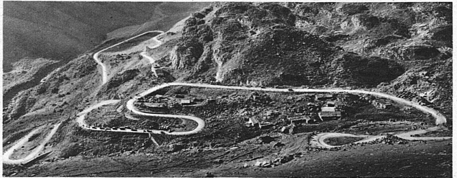
Klausenstrasse: Die Kehre der Vorfrutt

Die Vorbereitungen für die zehnte Austragung des Internationalen Klausenrennens sind bereits in vollem Gange, und es steht schon heute fest, dass es dieses Jahr eine bisher nie gekannte, qualitativ hochstehende internationale Beschickung erhalten wird; denn neben einer grossen Zahl Einzelfahrer werden alle massgebenden europäischen Firmen und Rennställe mit ihren neuesten Wagen vertreten sein. Viele hervorragende Sportwagenfahrer werden in der Schweiz einzig am Klausen an den Start gehen, da nur hier ein besonderes internationales Rennen für Sportwagen vorgesehen ist.