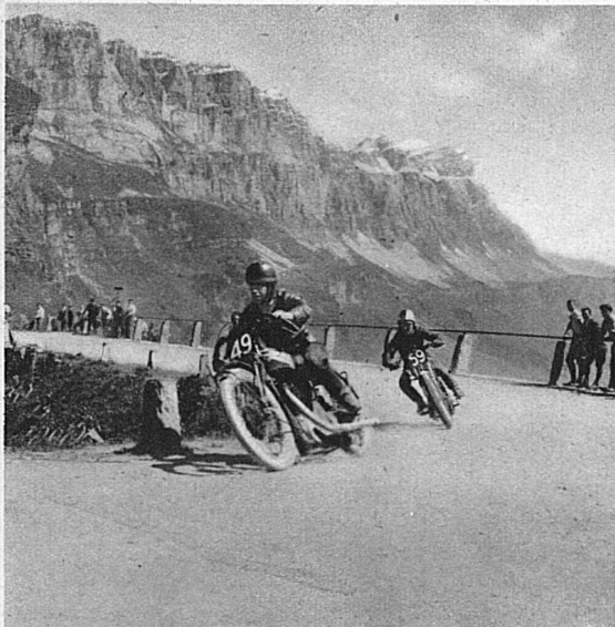
Ein Fahrer wird überholt