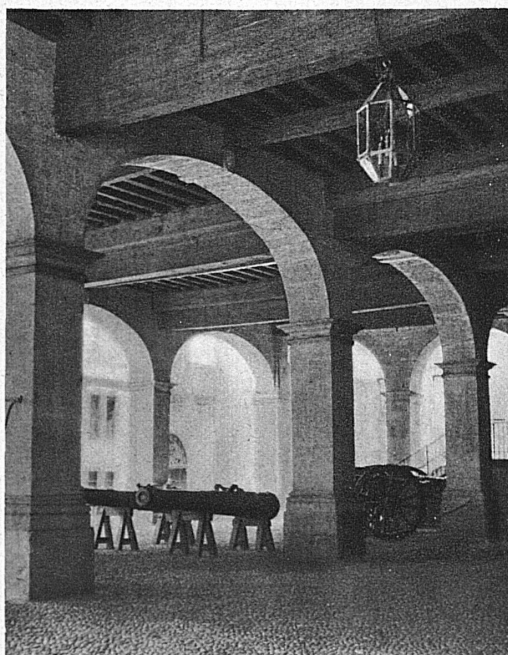
Cour intérieure de l'Hôtel-de-Ville de Genève

Les amateurs du passé, qui déplorent de voir tomber l'une après l'autre les retraites du bon vieux temps sous le balai moderne, trouveront dans Schaffhouse des consolations substantielles, des rues entières de minuscules hôtels blasonnés et balconnants, que la Renaissance construisit tout d'un souffle, et auxquels l'on n'a point changé un moellon. Et ce qui n'est point dans la rue est au Musée, dans les salles et les cloîtres du vieux couvent de Tous-les-Saints, où la cloche de Schiller retombée au silence est étrangement devenue le symbole du temps arrêté.