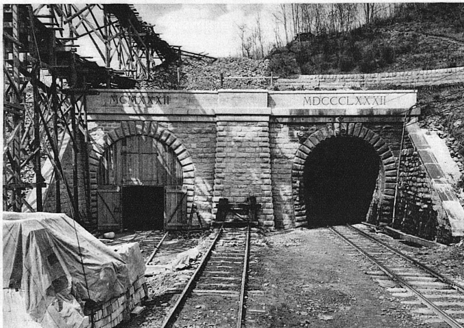
SBB Ceneri-Tunnel Südportal

3.-10. Januar: Internationales Tennisturnier auf gedeckten Plätzen. 14. Januar: Sprungkonkurrenz auf der Olympiaschanze. 23.-24. Januar: Cresta-Run-Rennen. 28. Januar, 1. und 4. Februar: Internationale Pferderennen auf dem St. Moritzersee. 29.-30. Januar: Boblet Grand prix. 2.-3. Februar: Bobletderby. 4.-18. Februar: Wintersportswoche des A.C.S. St. Gallen. 7. und 21. Januar und 4. Februar: Volkskonzerte.