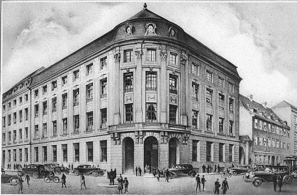
Gesellschaftssitz Basel . Siège social à Bâle