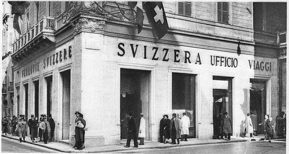
Die neueröffnete Agentur der SBB in Rom — La nouvelle agence des CFF à Rome — Corso Umberto I

est celui des estafettes militaires St-Gothard-Lucendro . L'équipe a un effectif de sept hommes dont au moins trois appointés ou soldats et au maximum deux officiers. Andermatt, qu'il est si aisé d'atteindre, qui possède un nouveau tremplin pour sauts longs, qui est à même d'assurer le succès d'un si grand nombre de concours en deux jours et demi, Andermatt sera au début de février un véritable point de ralliement. On s'est mis fiévreusement à l'œuvre et l'on prend toutes les mesures nécessaires pour recevoir dignement les as du ski. Aujourd'hui déjà, un seul mot est à l'ordre du jour : Andermatt !