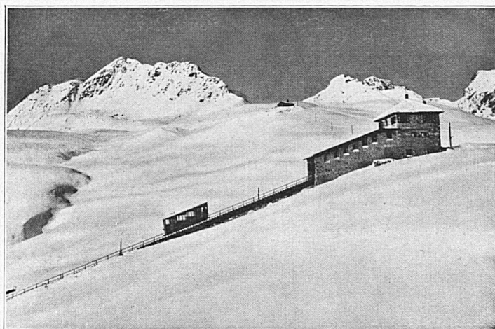
Drahtseilbahn Chantarella-Corviglia bei St Moritz, Engadin; erbaut 1928. - Oberste Station auf 2500 m Höhe ü. M.

St. Gallen. 23. März: Kammermusikabend. 30. März: Abonnementskonzert. 9. April: Palmsonntagskonzert.