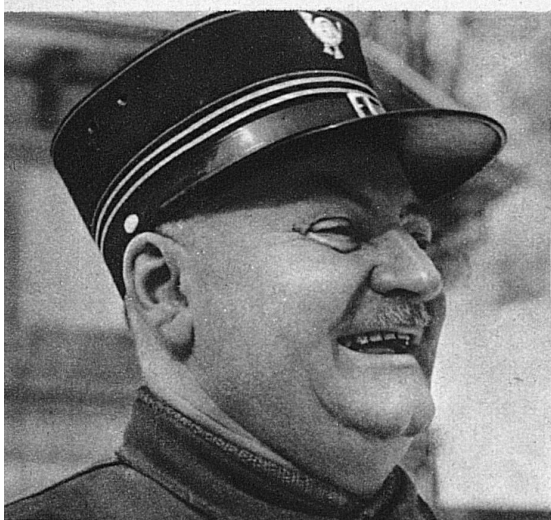
Ich kenne Grimsel, Furka und Gotthard wie meine Hosentasche