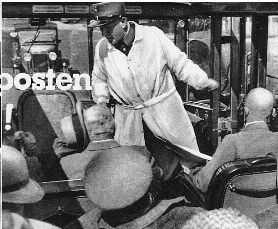
Im Postauto Meiringen—Gletsch Unten: Auf der Furkastrasse beim Rhonegletscher