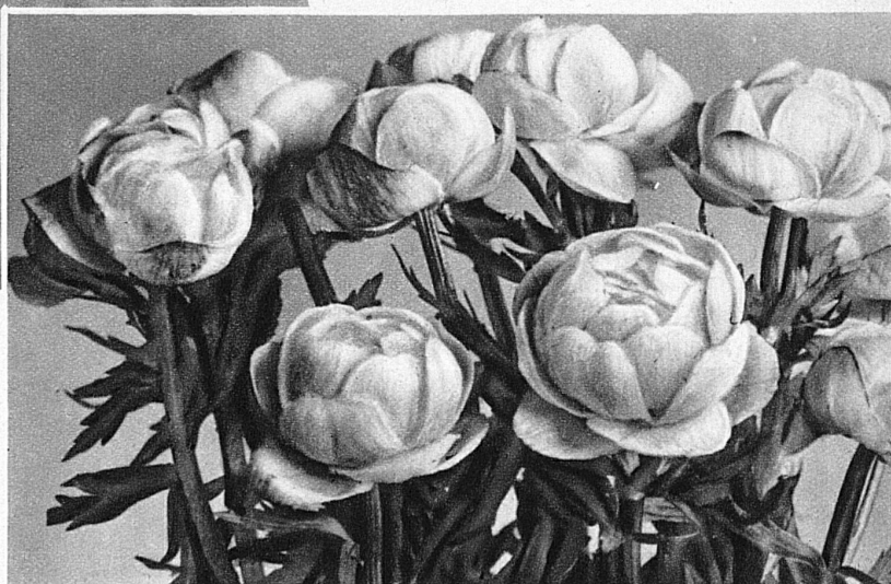
En haut: Renoncles de montagne

Seulement, pour arriver à réaliser ce rêve, pour contempler ce merveilleux spectacle de la nature, qui au dire de maints étrangers n'est pas le moindre de notre pays, il faut visiter la Suisse à temps voulu. Et ce temps-là n'est pas l'époque des vacances estivales. C'est la