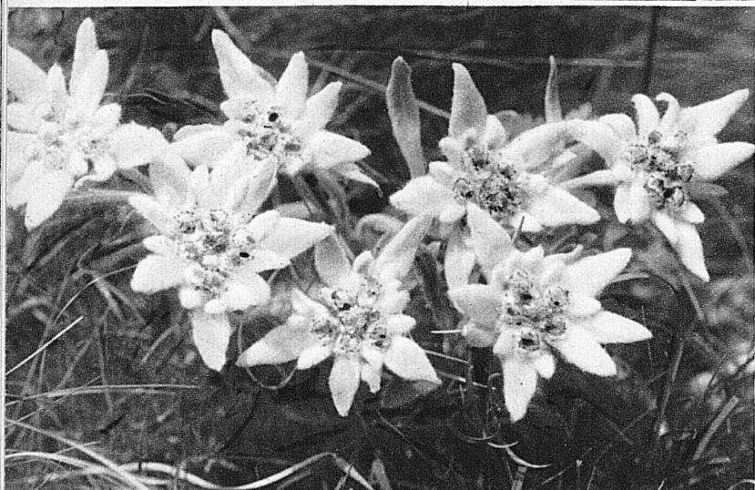
En haut: Saxifrages et Edelweiss