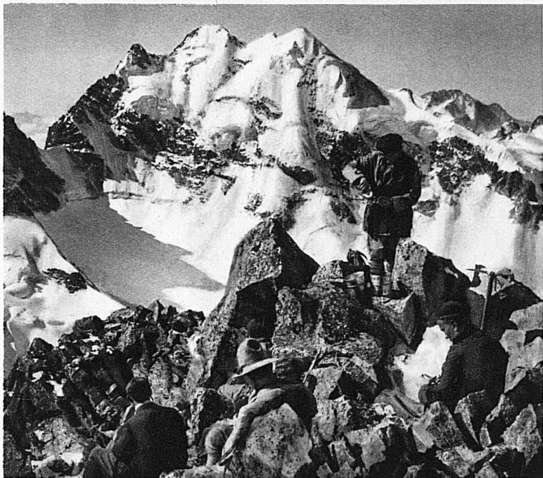
Le Piz Roseg

Au-dessous: Maloja, le lac de Sils et le Piz Rosatsch