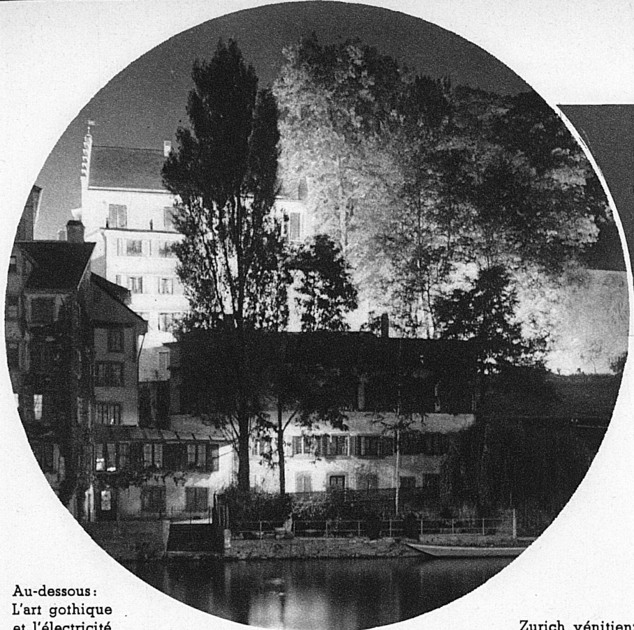
Au-dessous : L'art gothique et l'électricité