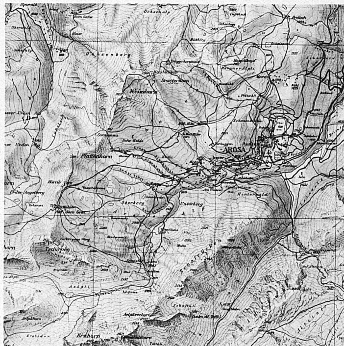
Partie de la carte de ski de la région d'Arosa (1 : 25 000), éditée par Kümmerly et Frey, Berne