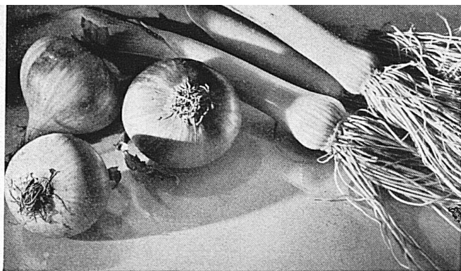
Freiburg zeigt vom 5.-16. Okt. in einer Nahrungsmittelmesse seine Erzeugnisse aus Feld und Garten und die übrigen Produkte für Küche und Keller