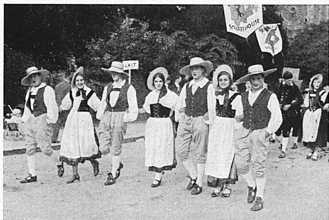
Das Winzerfest in Neuenburg am 1. Okt. ist ein grosses Herbstereignis, das niemand versäumen sollte