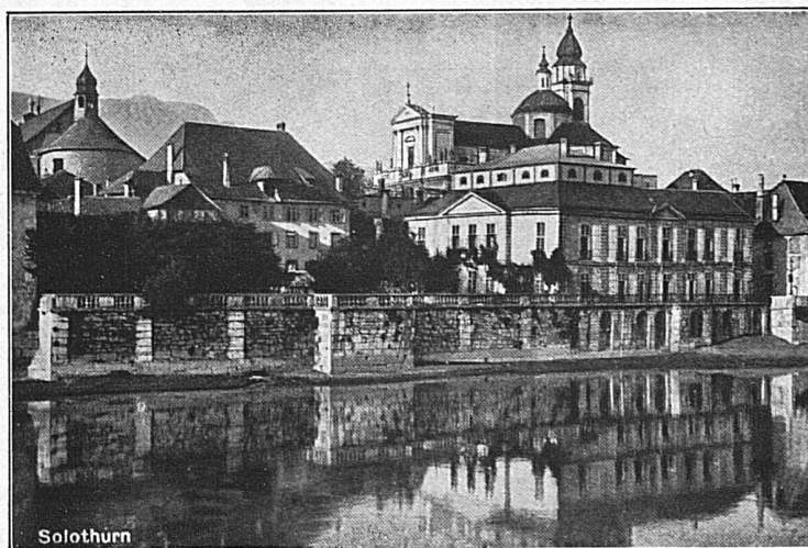
Solothurn: Alter Bischofspalast und St. Ursuskathedrale

Auskünfte bereitwilligst durch die Stationen der Solothurn-Zollikofen-Bern-Bahn und die Betriebsdirektion in Solothurn