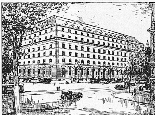
Zürich, mit Wechselstube im Hauptbahnhof

Amriswil Genève Basel Glarus Bern Kreuzlingen Biel Lausanne Brugg Locarno Delémont Luzern Fribourg Montreux