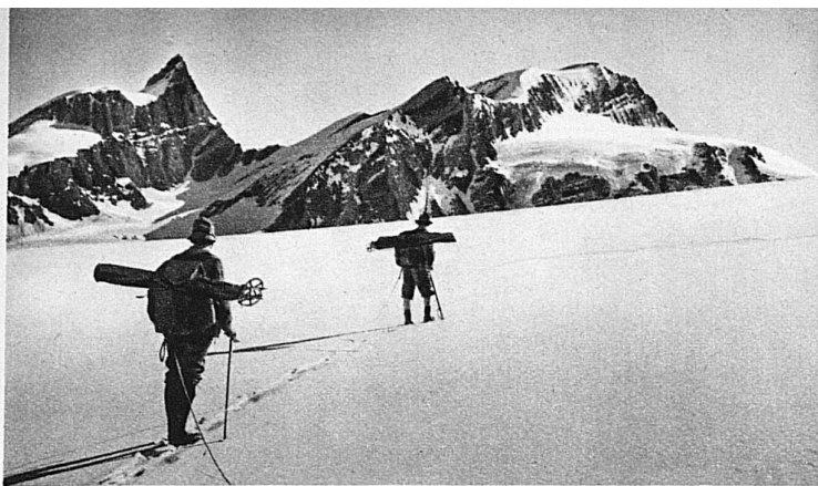
So tragen begeisterte Sommerskifahrer die 120 cm langen Doppel-laufskier samt Stöcken in Leinwandhüllen