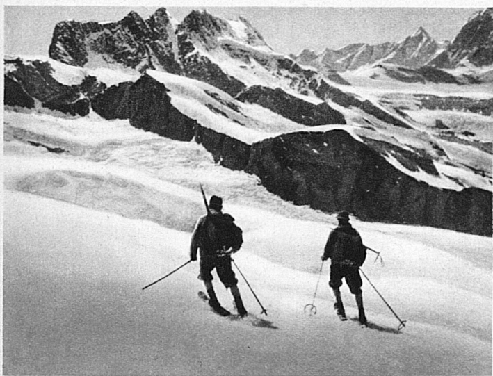
Monte Rosa-Abfahrt an einem sonnendurchfluteten Junitag. Blick auf das Breithorn