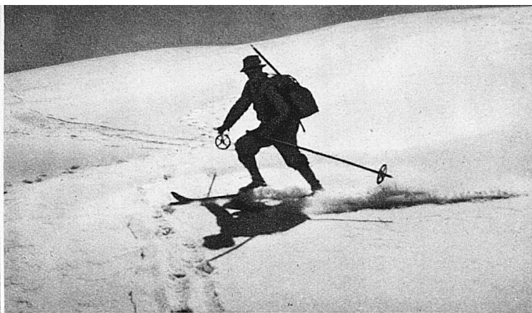
Stiebende Abfahrt im Pulverschnee im Monat Juli von der Cima di Jazzi herab

gleichlich. Dort kann man tatsächlich das ganze Jahr skifahren, aber nicht nur am Joch – auch die Eismeerabfahrt kann man im Frühsommer noch machen.