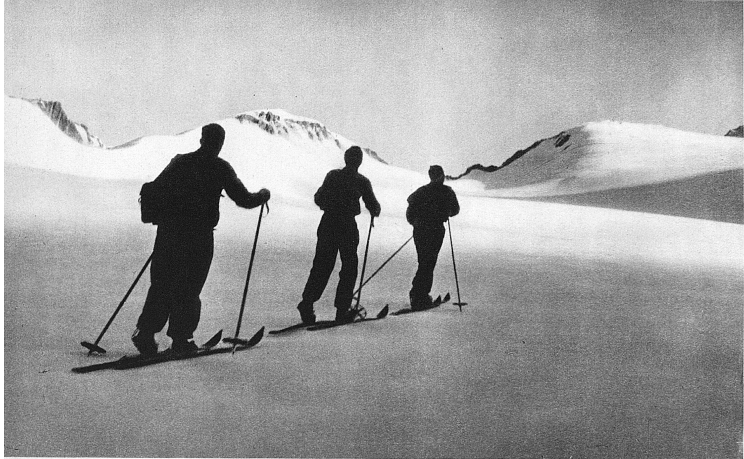
Im ersten Morgenlicht eines herrlichen Sommertages hinauf auf dem Rhonegletscher zum 3633 m hohen Dammastock