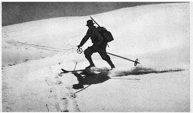
Stiebende Abfahrt im Pulverschnee im Monat Juli von der Cima di Jazzi herab

gleichlich. Dort kann man tatsächlich das ganze Jahr skifahren, aber nicht nur am Joch – auch die Eismeerabfahrt kann man im Frühsommer noch machen.