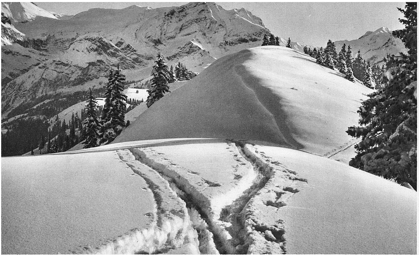
Voyez cette neige épaisse et ces douces collines! Il en est partout de même dans la région de Gstaad, centre important pour les skieurs

eux pour acquérir cette formation complète, car leur pays, à mesure qu'ils le découvraient, s'est révélé une véritable Université, en ce sens qu'à côté des centres fameux comme Grindelwald, Kl. Scheidegg, Jungfrau-joch, Wengen ayant chacun leur doctrine, on trouva, en parcourant toute la contrée, les terrains les plus divers permettant aux skieurs de parfaire leurs connaissances et d'élever leur technique à un niveau supérieur. Car s'il y a dans l'Oberland bernois les pentes raides, vertigineuses de Murren, il y a aussi les longues descentes, plus douces, qu'offrent les régions de Gstaad, de Saanenmœser, d'Adelboden, de Zweisimmen, de Beatenberg, de Brunig-Hasliberg, de Lenk et de Kandersteg. Dans l'ouest de l'Oberland, le skieur rencontrera des terrains où il pourra, même sans être un virtuose, faire de longues promenades au cours desquelles il complétera son instruction. Les pentes y sont plus douces, les collines plus arrondies. Dès qu'on se rapproche de la haute montagne, le terrain est plus coupé, les contours plus rudes, les pentes plus courtes et plus raides, de sorte qu'à côté de plateaux magnifiques et de longues descentes harmonieuses, le skieur éprouvé pourra exploiter toutes les ressources de son talent. La montagne lui présentera à résoudre les problèmes les plus compliqués et aussi les plus passionnants. Il ne fait en tout cas pas de doute que celui qui fréquentera beaucoup l'Oberland bernois en hiver, y acquerra une culture raffinée et définitive. B.