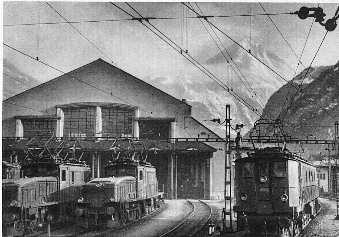
Le dépôt des locomotives d'Erstfeld et le village de Wassen

Avant d'atteindre Andermatt, on traverse de délicieux villages blottis dans les sapins au fond des vallées. La photographie représente l'église de Wassen, célèbre sur la ligne du St-Gothard.