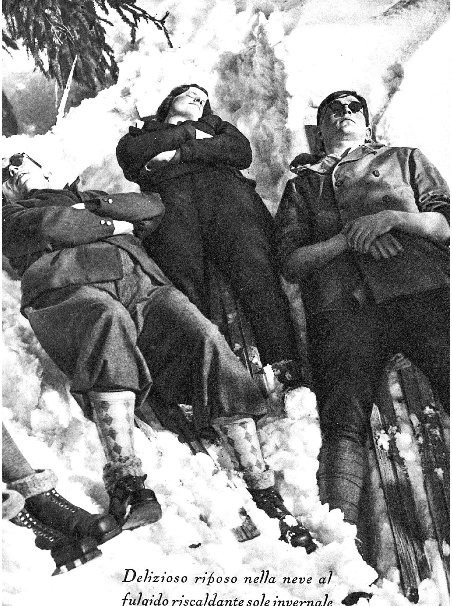
Delizioso riposo nella neve al fulgido riscaldante sole invernale