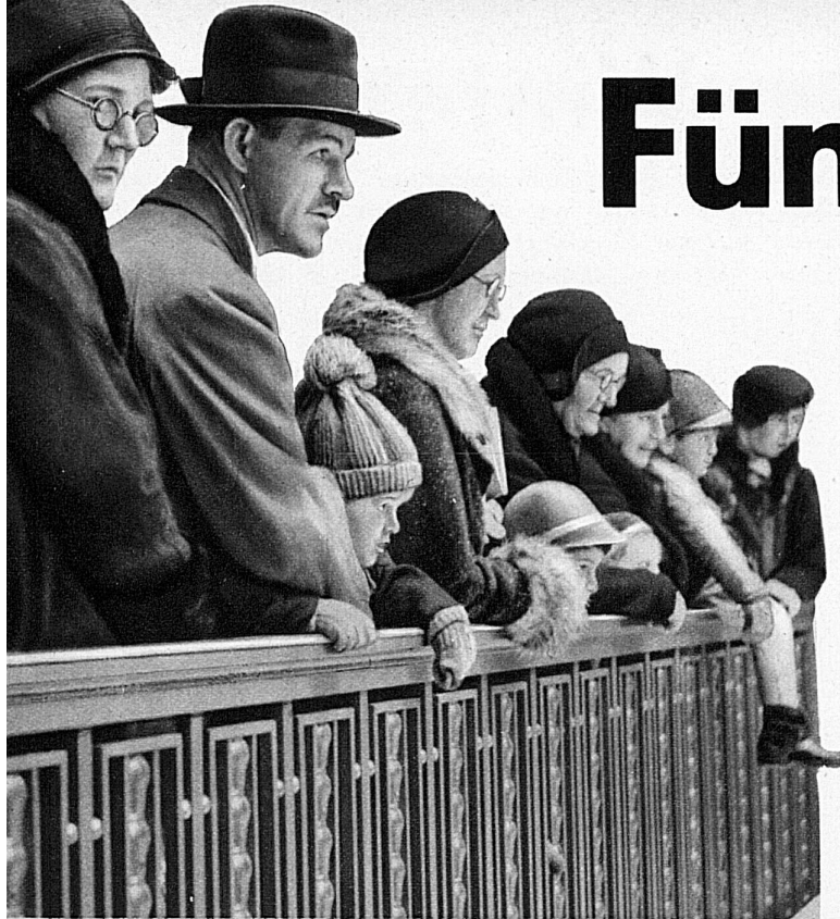
Alt und Jung bestaunt das Wunderwerk

Der Führerstand. Von hier aus lässt sich die ganze Bahn übersehen und der Zugsverkehr regeln