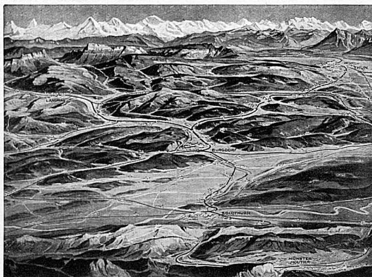
BLICK VON DEN JURAHOHEN DES WEISSENSTEINS NACH SÜDEN : Ausgangspunkte: Stationen Gänsbrunnen und Oberdorf (Sol.). Autokurs Gänsbrunnen-Weissenstein. Ermässigte Sonntagsbillette

den Wirkungskreis des grossen Volksschriftstellers Jeremias Gotthelf