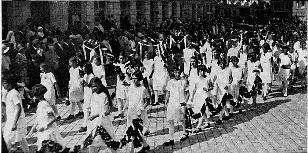
Festzug durch die Stadt

gebratene Kinderfestbratwurst in Extragrösse. — Wer St. Gallen und die St. Galler in gehobener Feststimmung kennenlernen will, der reserviere den 5. Juli für den Besuch des St. Galler Jugendfestes. belka.