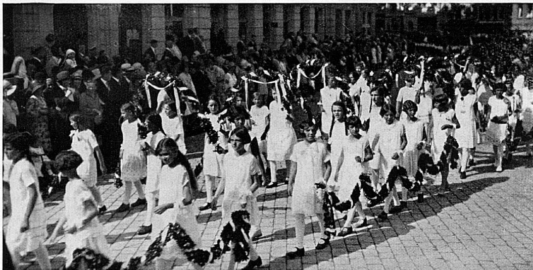
Festzug durch die Stadt

gebratene Kinderfestbratwurst in Extragrösse. — Wer St. Gallen und die St. Galler in gehobener Feststimmung kennenlernen will, der reserviere den 5. Juli für den Besuch des St. Galler Jugendfestes. belka.