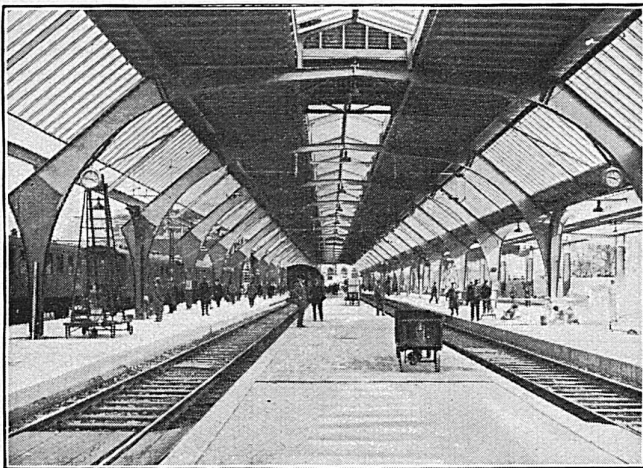
Perronhalle 1 im Hauptbahnhof Zürich Projekt und Teilausführung durch die AG. Theodor Bell & Co., Kriens

Publiée par la Direction générale des chemins de fer fédéraux. Rédaction: Secrétariat général à Berne / Annonces, Impression et Expédition: Büchler & Cie, Marienstrasse 8, Berne / Paraît une fois par mois / Abonnement: 1 année fr. 10.—, 1 N° fr. 1.— / Chèques postaux III 5688