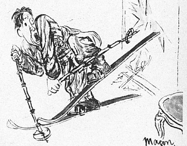
Exercice en chambre: Effet inattendu d'un christiania!