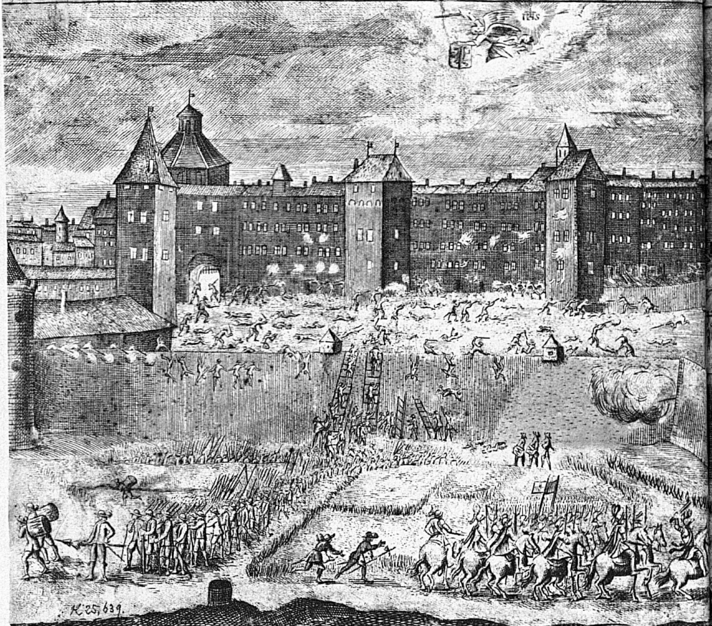
Ganz links im Bilde die Porte de la Monnaie, der Turm rechts davon ist die Corrairie; in der Mitte die Porte de la Tertasse, davor die Oie-Schanze; ganz rechts das Neue Tor und zu äusserst rechts das Rathaus. Das Bild stellt alle Phasen der Escalade gleichzeitig dar: Besammlung der Savoyer in Plainpalais, Er

VRAYE REPRESENTATION DE L'ESCALADE ENTREPRISE SVR GENEVE PAR