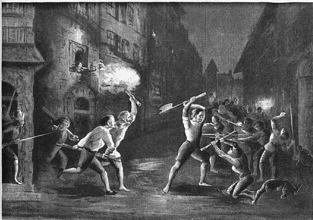
Jählings aus dem Schläfe geweckt, eilen die Genfer Bürger auf die Strasse, wo ein wütender Kampf entbrannt ist.

Nach einem dem taubstummen Miniaturmaler und Graveur François Diodati von Genf (1647—1690) zugeschriebenen Kupferstich.