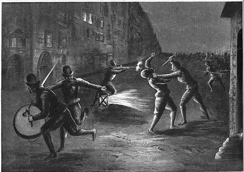
Wachtmeister Boussez, der Führer der Ronde, der die Eindringlinge bemerkt und angerufen hatte, wird von Brunaulieu erstochen. Laternenträger und Tambour eilen zur Porte de la Monnaie und alarmieren die Wache.