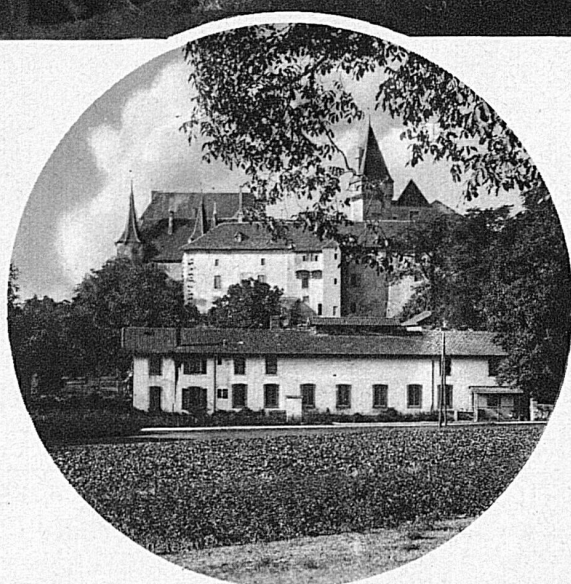
A gauche: Auvernier au fond de sa gracieuse baie. Dans le médaillon: Le château de la place d'armes de Colombier.

en franchissant le pont de Thielle et en jetant un regard sur le château planté au bord de l'ancien lit de la rivière. Quelques kilomètres encore et nous sommes sur la rive sud que des frontières cantonales, étrangement découpées font vaudoise, fribourgeoise, vaudoise encore et de nouveau fribourgeoise et vaudoise enfin.