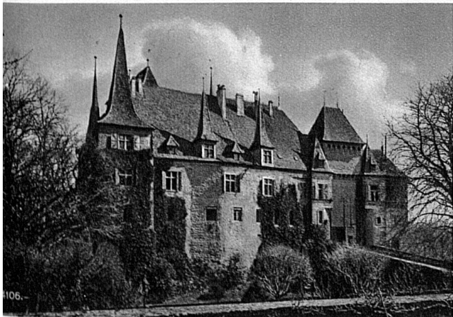
Le château de Gorgier