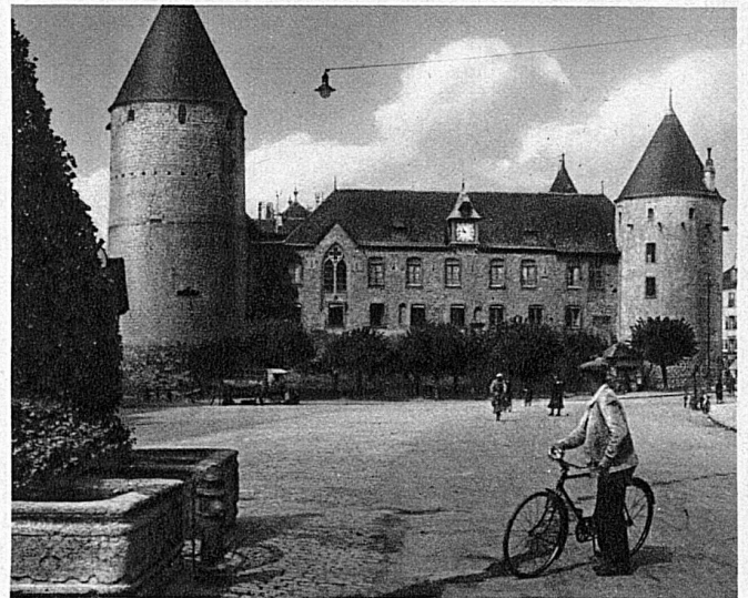
Le château d'Yverdon