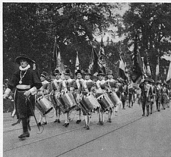
En haut: Un groupe de la fête de vendanges à Neuchâtel, qui, cette année, aura lieu les 3 et 4 octobre.