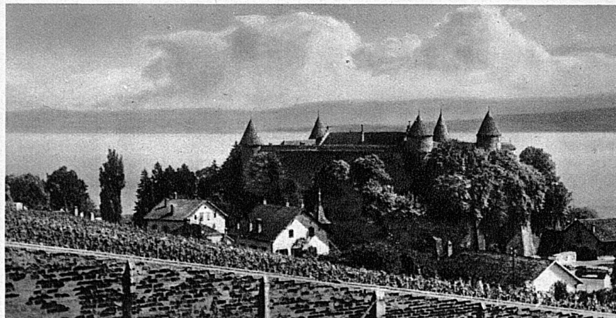
Le château de Grandson, qui vit la défaite du Téméraire