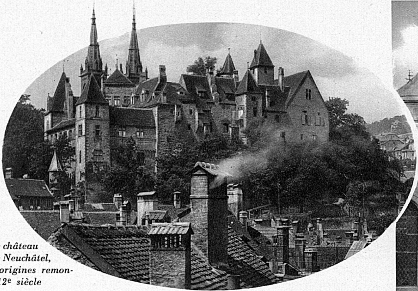
L'antique château féodal de Neuchâtel, dont les origines remontent au 12 e siècle

Si l'on parle du lac, de ses charmes, de ses beautés changeantes, c'est surtout pour célébrer les plaisirs du sport nautique, du canotage, de la voile ou de la natation, pour vanter l'agrément des plages ou des baies ensoleillées. La mode veut cela, direz-vous. Mais, il ne s'agit pas ici d'une simple fantaisie. La faveur dont jouissent les plages n'est pas seulement signe de snobisme, cette mode-là est raisonnable et on peut, de jour en jour, en apprécier les bienfaits.