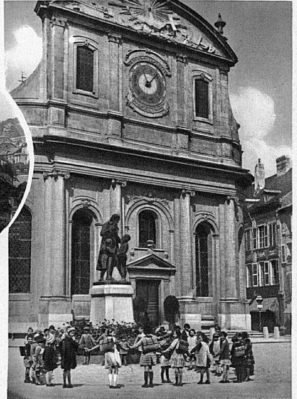
A Yverdon: La statue de Pestalozzi, l'ami des enfants

Plus loin, c'est Marin, enfoui dans la verdure. La route, un instant étranglée par le village, file ensuite entre le lac et le plateau de Wavre, pour nous mener en pays bernois, où l'on entre