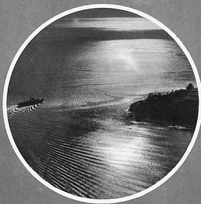
Pioggia d'argento, nel Crepuscolo