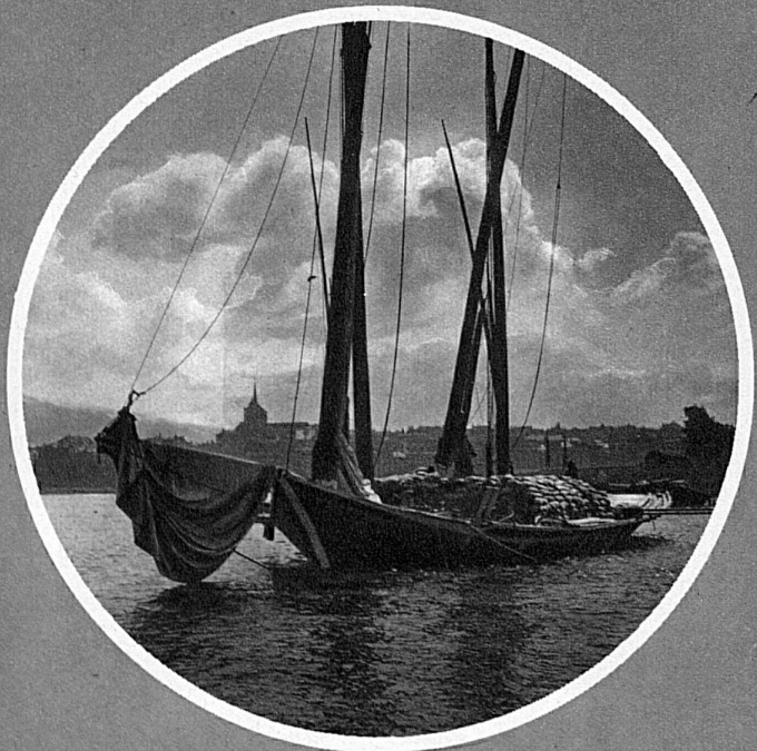
La poesia del lavoro nella quiete del lago