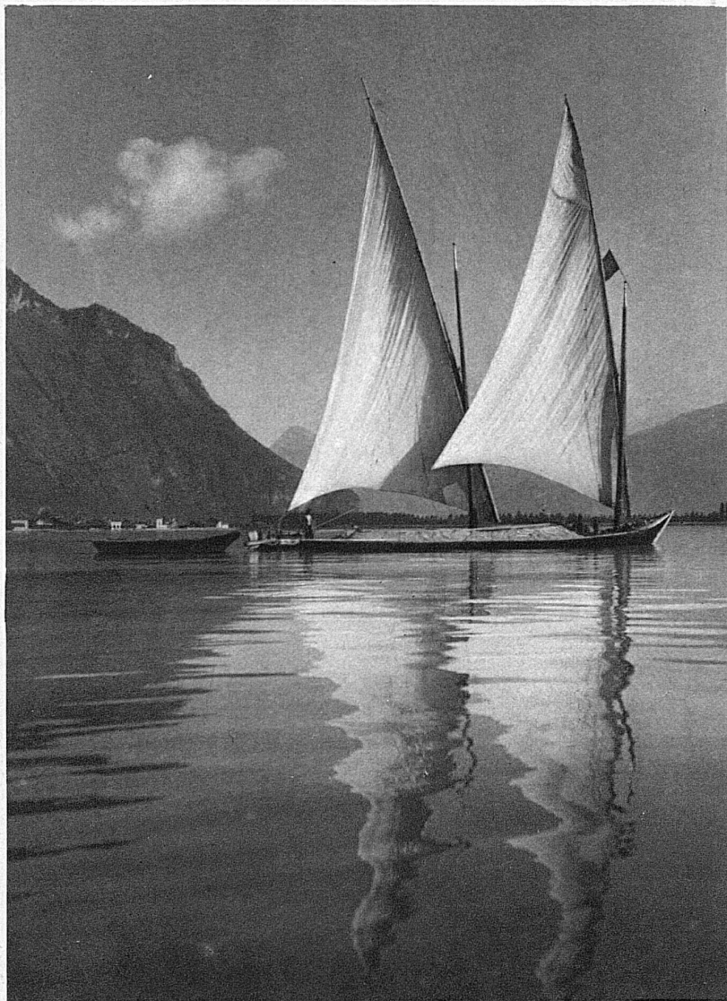
Sponsali di candide vele e di acque cristalline

Quando, venendo dall'Italia, il paesaggio costretto fra le montagne del Vallese (che pur costituiscono uno scenario fantastico) si allarga sull'azzurro cristallino del Lemano, si prova immancabilmente un senso di gioia: è la serenità del panorama che si riflette nell'anima di chi guarda. Territet, Montreux, Vevey-ove l'eleganza mondana si intona mirabilmente alla superba bellezza dei luoghi-sorridono al viandante e gli fanno sognare delizie sconosciute. Qui la vita è gaia, è bella: non può non esserlo: per nessuno, per nessuno. Chi ha detto che