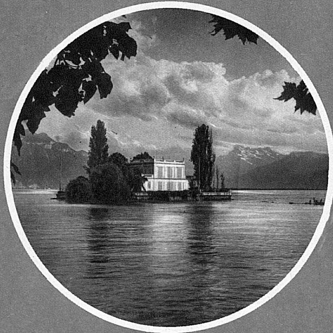
Un ciuffo di verde nell'azzurro: l'isola di Salagnon