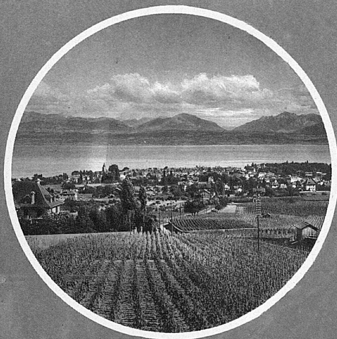
Le ridenti rive del cantone di Vaud: Morges