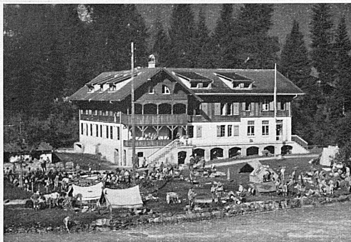
Internationales Pfadfinderheim in Kandersteg

Länder hausen werden. — Aus 34 Staaten und allen Erdteilen kommen sie her, 3000 Mann hoch, um in gemeinsamen Konferenzen den Gedanken ihres Zusammenschlusses zu erwägen und Exkursionen im Berner Oberland, gemeinsame Gebirgsfreuden und Abenteuer zu erleben.