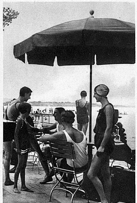
Phot. Steiner-Photomutz, Bern., Keller