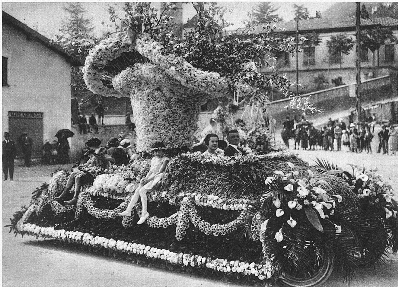
Corso fleuri de la fête des Camélias à Locarno