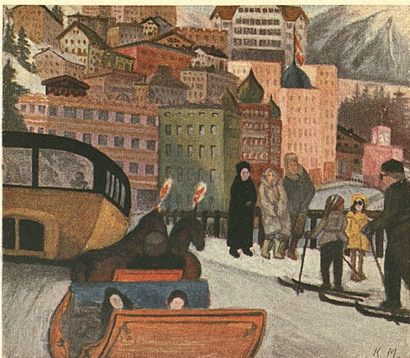
Eene wijk van St. Moritz in Zwitserland met schilderachtige en cosmopolitische architectuur, weerspiegelend de typische tegenstelling van den nog Italiaansch lijkenden hemel en het reeds noordelijke klimaat

Den volgenden dag begint natuurlijk een ieder met het voor hem het meest ongewone, het ski-en. Na den middag binden allen, en vooral wij Hollanders die nog steeds de ijssport onze nationale sport noemen, de schaatsen onder de voeten en gaan op de ijsbaan wat baantjerijden, of les in het kunstrijden nemen, of met hen, die het stevigst op de schaatsen staan, het snelle ijshockeyspel beoefenen. En zoo gaat het iederen dag verder, afgewisseld door bobrennen, sleetjevaren of skijöring (achter het paard), totdat men zich zoo sterk en gezond gevoelt, als een der krachtige in deze bergwereld geboren Zwitsers zelf. En het goede