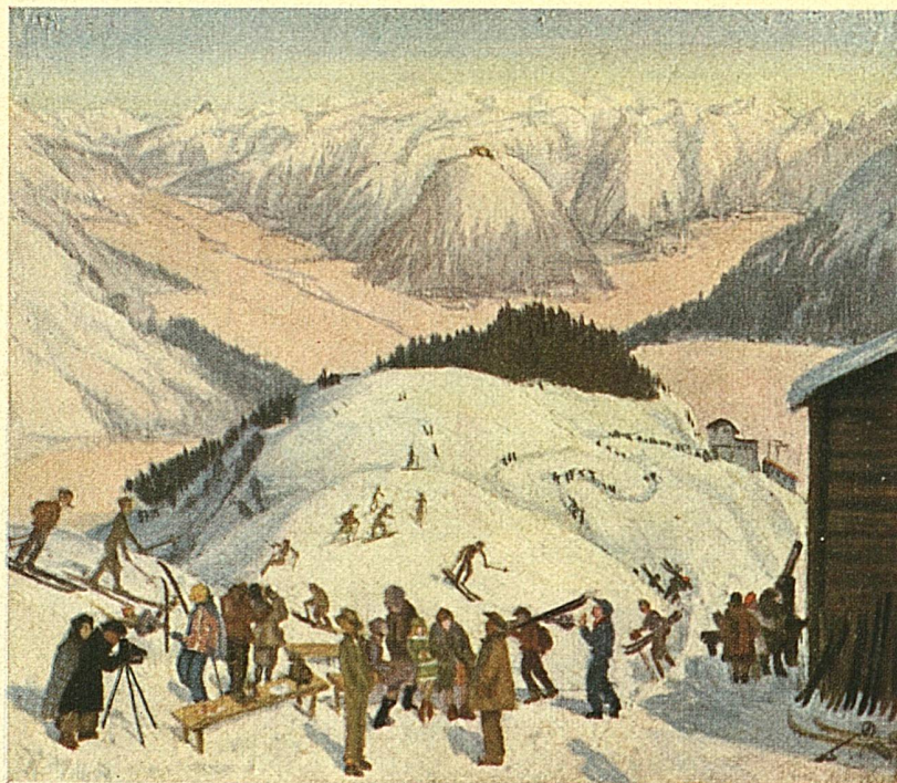
In den winter krioelen de Zwitsersche bergen als een mierenhoop van ontelbare toeristen, liefhebbers van ski, bobslee en schaatsenrijden

Het Eldorado van de wintersport is reeds zijn voorbereidselen begonnen, om ook in dezen winter zijn gasten uit alle landen der wereld te ontvangen. Zoodra de eerste sneeuw gevallen is, beginnen de wintersportplaatsen met hun voorbereidingen, opdat glinsterende ijsbanen, ijziggladde bobbanen, hier en daar ook een koene skeletonbaan, en dan natuurlijk ook de skisprongheuvels en de sledebanen, overal tijdig gereed zijn. Doch de wintersportplaatsen hebben nog meer voorzieningen te treffen: oefenmeesters in het schaatsenrijden en skilopen, danskunstenaars op het ijs en op het parket moeten in dienst worden genomen, geheel afgezien nog van de honderden andere hulptroepen, die het land, dat terecht op zijn uitnemende hotelwezen trotsch is, noodig heeft. Hotelorkesten trekken met viool en pauke naar het hooggebergte, reusachtige vrachtwagens voeren groote voorraden etenswaren voor de in de gezonde alpenlucht dubbel-hongerige sportmensen naar boven, en gaandeweg geraken al die stille berg-