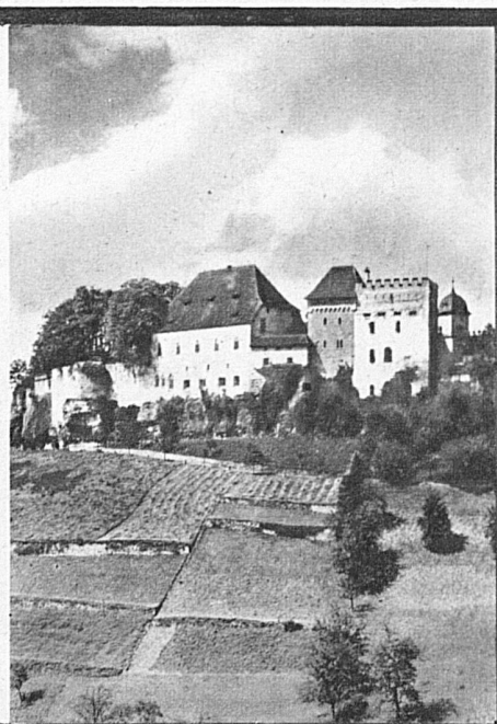
Le château-fort de Lenzbourg