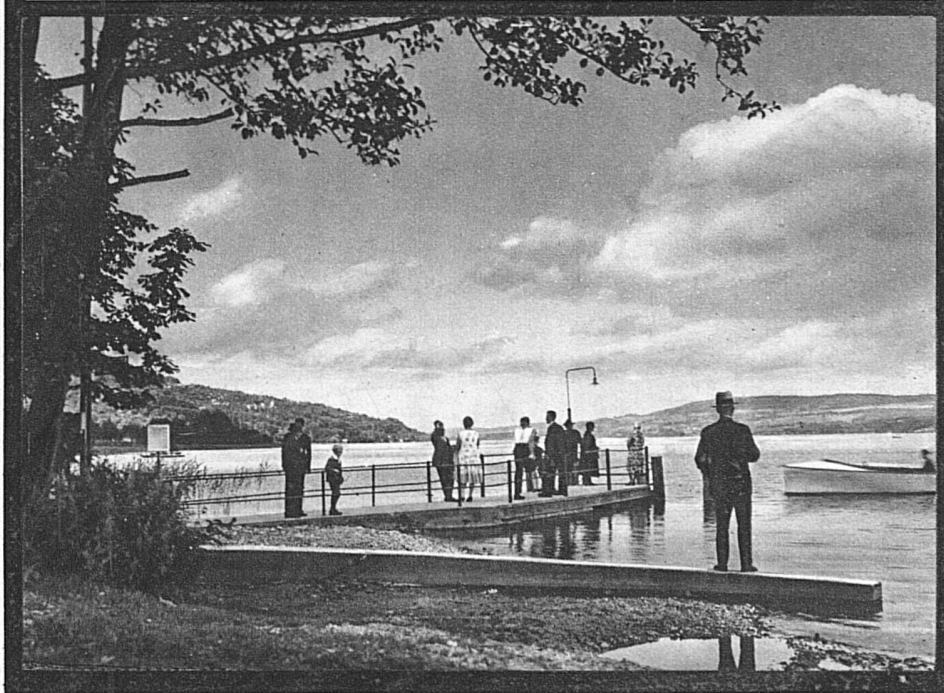
Le débarcadère de Beinwil, sur le lac de Hallwil

tique de 1796, le souvenir de Gessner en relatant ses propres pérégrinations.