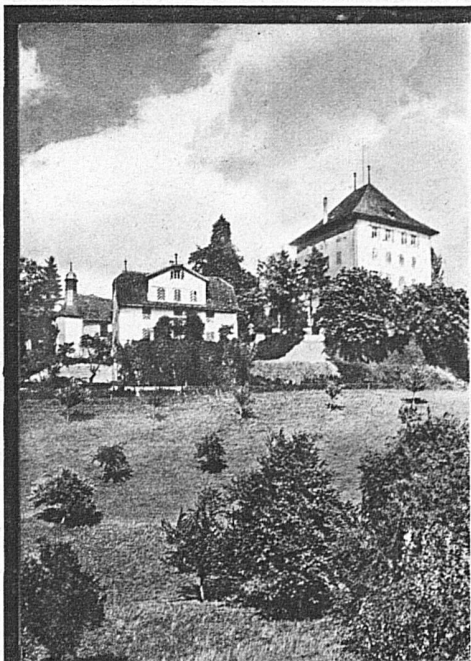
Le château de Heidegg près de Hitzkirch

Mais le soir tombe sur les coteaux et sur les rivages. La brise tiède du midi froisse en passant les roseaux et berce les nénuphars. Et des auberges on entend monter, à trois ou quatre voix, les couplets anciens et toutes les mélodies d'un peuple qui tient à ses traditions: « Im Aargäu sind zwei Liebi ... »