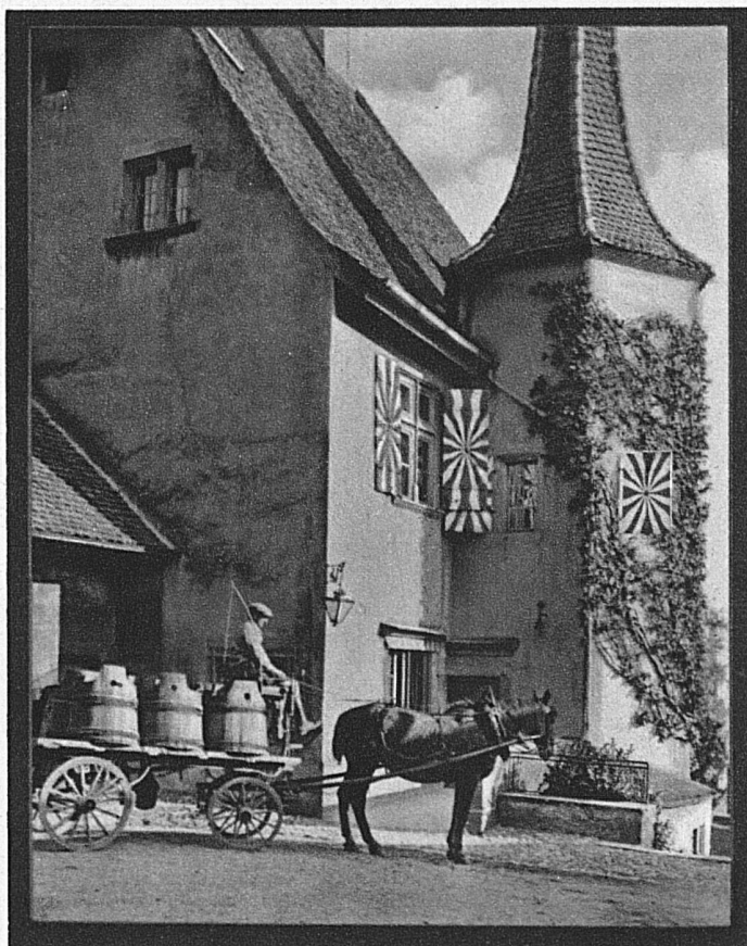
Fahrt zur Kelter im Schloss Beauregard bei Neuenburg