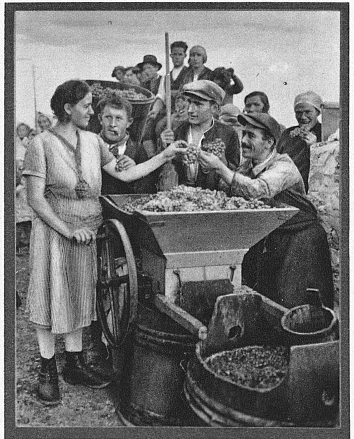
Reiche Ernte in den Neuenburger Weinbergen

Mit solcher Freude und gesteigerter Lebensenergie erwartet Neuenburg seine Gäste zum heurigen Winzerfest! — U. A.