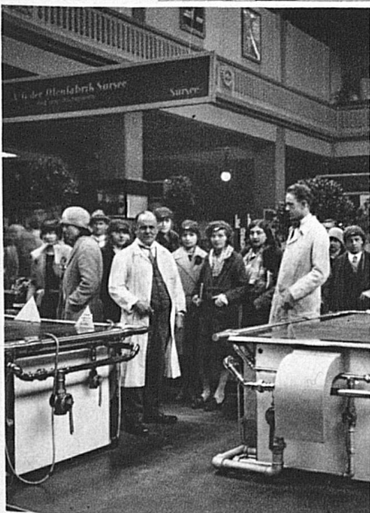
In der Basler Mustermesse