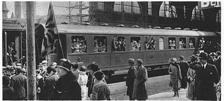
Abfahrt im Bahnhof Zürich nach Basel