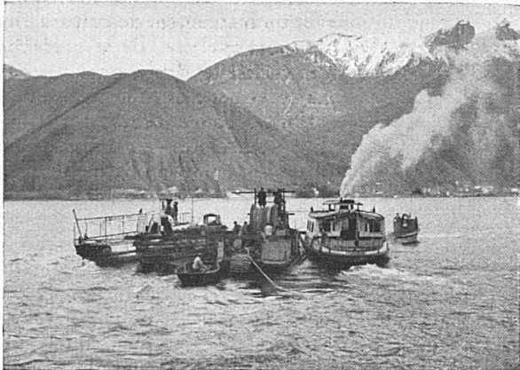
Abfahrt der Verlegeflotte in Poiana

Lieferanten von Starkstromkabeln (speziell Hochspannungskabeln) und von Schwachstromkabeln: Haupt- (Krarup-) und Nebenkabeln für die Elektrifizierung der Schweiz. Bundesbahnen