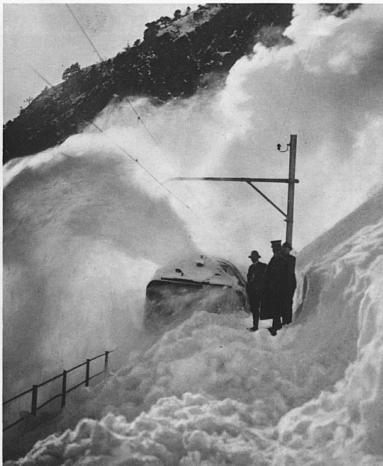
Schneeschleuder am Lötsch- berg

Die Schöllenenbahn bei den Teufelsfällen der Reuss Le chemin de fer des Schoellenen près du pont du Diable, le long des rapides de la Reuss The Schoellenen Railway, near the Devil's Falls, on the Reuss La ferrovia delle Schöllenen presso il ponte del diavolo sulla Reuss