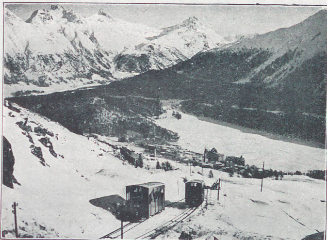
Drahtseilbahn Chantarella-Corvigliahütte, 2550 m ü. Meer bei St. Moritz, Engadin. Neueröffnung: Mitte Dezember 1928 - Blick auf die Ausweiche, auf St. Moritz u. Pontresina

6° Les skis et luges, ainsi que les skeletons et les bobsleighs (ces derniers pour autant que leur transport peut s'effectuer sans inconvénients par les trains entrant en jeu) peuvent aussi être remis au transport comme bagages, étant entendu que deux ou plusieurs paires de skis ou deux ou plusieurs luges peuvent constituer une seule expédition accompagnée d'un seul bulletin de bagage.