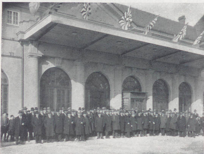
Inauguration de la gare de Fribourg le 31 janvier. Les invités devant l'entrée principale

Le bâtiment aux voyageurs de la nouvelle gare de Fribourg a été inauguré jeudi, 31 janvier dernier. Cet événement attendu avec impatience par les Fribourgeois a été le couronnement de près de deux ans d'efforts. L'emplacement de cet édifice avait déjà donné lieu à de vives polémiques. Une partie de la population aurait préféré qu'il fût reconstruit exactement au même endroit que l'ancien, mais aujourd'hui l'emplacement choisi donne