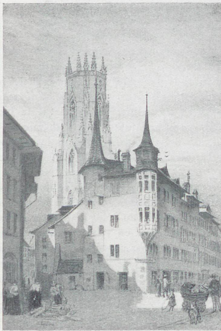
Fribourg d'après d'anciennes estampes de J. Reichlen