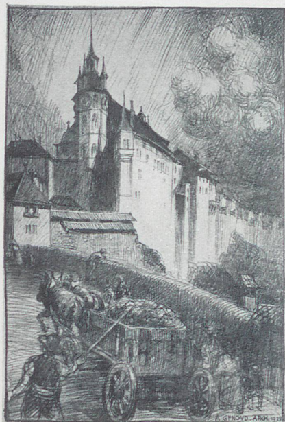
Freiburg nach neuen Stichen von Augustin Genoud