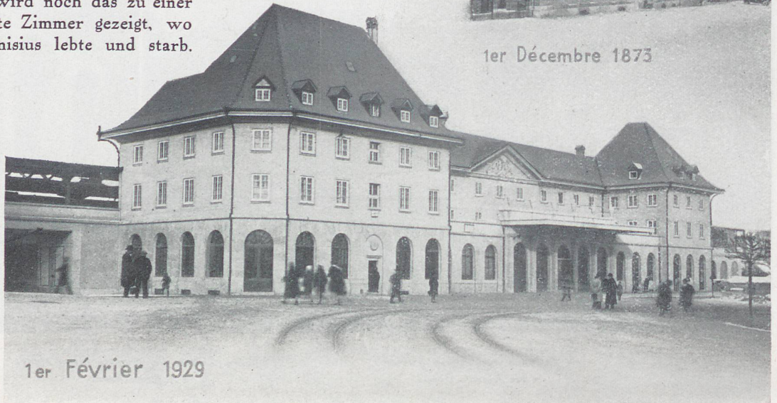
Die Hauptfront des neuen Bahnhofgebäudes in Freiburg / La façade principale de la nouvelle gare de Fribourg Oben der alte Bahnhof / Au-dessus l'ancienne gare

fangreichen Klosterkomplexe ein, die mit den sie umgebenden hohen, geschwärtzten Mauern manchmal fast den Eindruck erwecken, als seien sie befestigte Kastelle. Hoch über den Saanefelsen liegen die Klöster der Franziskaner und Kapuziner. In einem sonnenlosen Talwinkel wohnen die Nonnen der Maigrange, die das berühmte «Grüne Wasser» — ein Heiltrank für Kranke — herstellen, während nicht weit davon die Schwestern von Montorge ihr beschauliches Leben führen. Man muss besonders auch eines der grossen kirchlichen Feste, an denen die ganze Stadt teilnimmt, gesehen haben, mit dem Prunk schwerer gestickter Fahnen, kultischer Gewänder und Geräte, um Freiburg ganz zu begreifen. L.