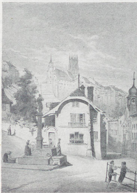
Freiburg nach alten Stichen von J. Reichlen