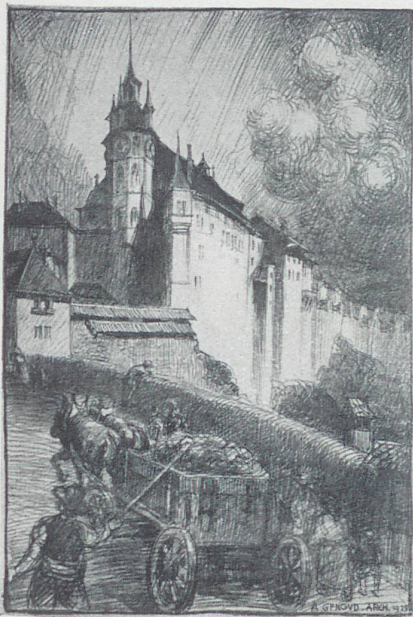
Freiburg nach neuen Stichen von Augustin Genoud