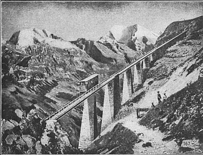
SEILBAHN NIESEN, Berner Oberland. Totale Länge 3496 m, überwundene Höhe 1645 m. Maximalsteigung 68%.

Walzwerke, Schmiede, Gießereien, Elektrostahlwerk, mech. Werkstätten