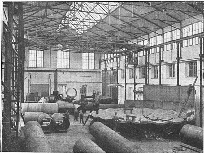
Unsere Kesselschmiede-Werkstatt Eiserne Baukonstruktion und Kranträger, erstellt 1923

Urnäsch. 25. Dezember bis 1. Januar: Skikurs im Gebiet Kräzerli-Schwägälp.