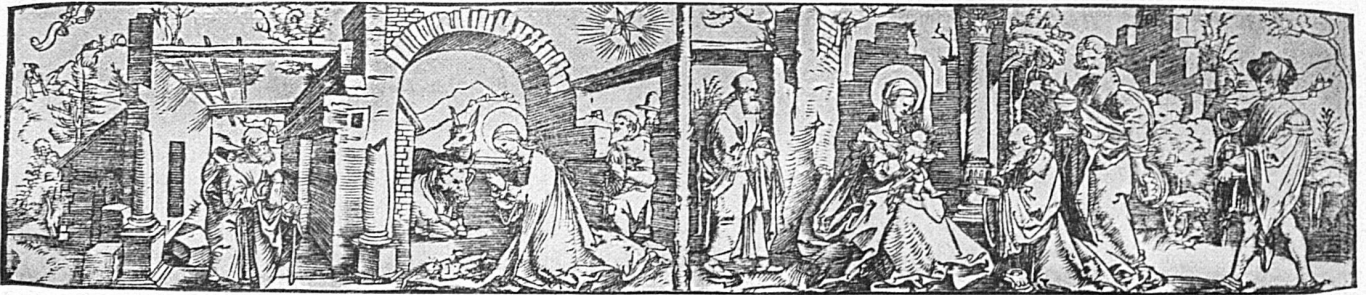
Hans Leu von Zürich. Nach Dürer 1520 Original im eidg. Kupferstichkabinett Zürich