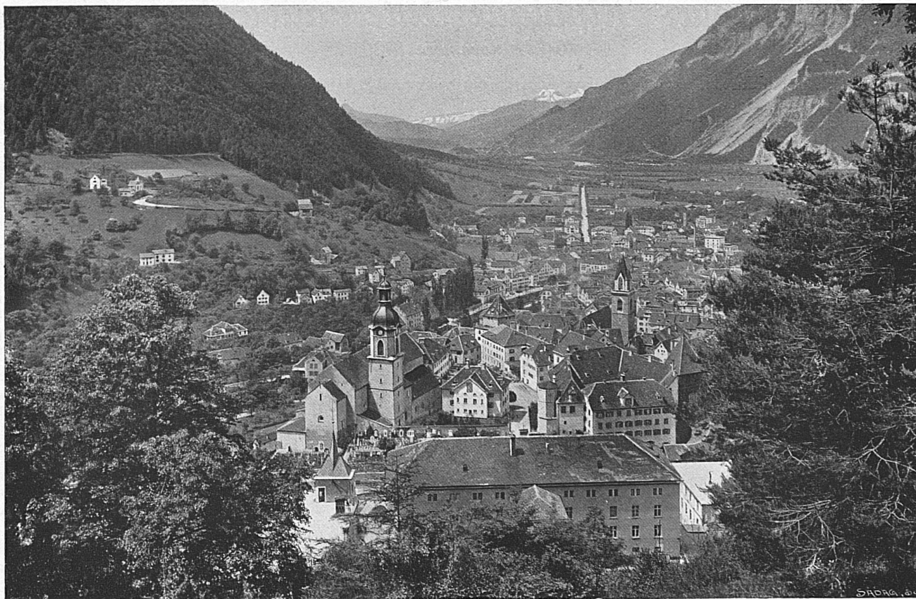
Chur, im Tal des Rheins / Coire, dans la vallée du Rhin