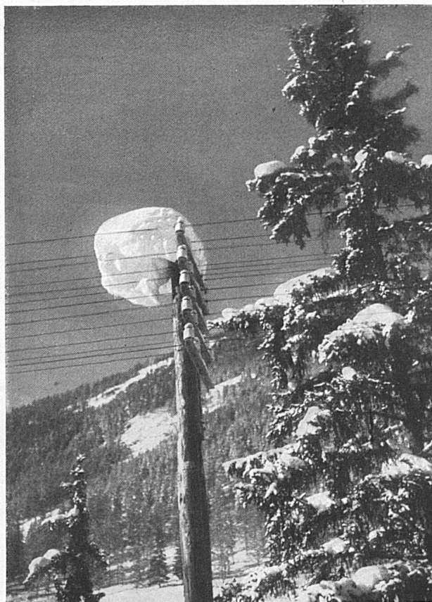
Comment la neige entrave le service du téléphone

pagne, de Gibraltar, de la Grande-Bretagne et du Portugal, rendront de précieux services dans les cas où celui qui désire une communication téléphonique émettra un doute au sujet de la présence de son correspondant à la station demandée. Les conversations à heure fixe permettent aux commerçants de s'assurer une communication avec une personne se trouvant à telle ou telle heure à un endroit déterminé. Les demandes de renseignements permettent aux usagers du téléphone, dans la correspondance internationale, de se renseigner pour savoir si une personne désignée par son nom et son adresse possède un raccordement ou de s'enquérir du nom d'un abonné dont ils ne connaissent que le numéro. Les conversations avec une personne spécifiée sont admises seulement dans les relations avec l'Amérique.