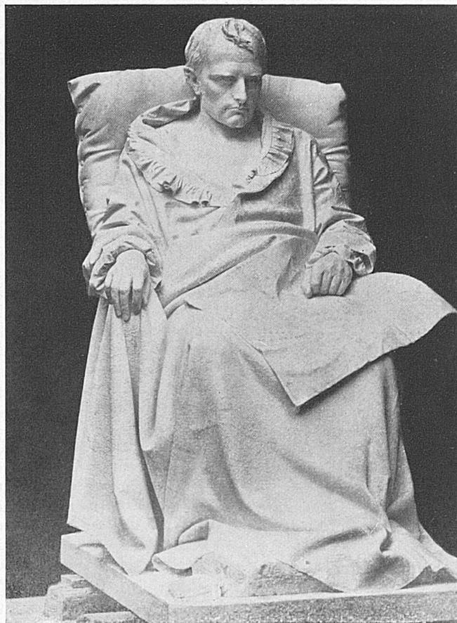
« Der sterbende Napoleon »

de Vela est son haut-relief « Les victimes du travail ». Dédié à l'esprit d'entreprise d'Alfred Escher et de Louis Favre et à la puissance de travail du peuple, destiné à être placé au-dessus du portail nord du tunnel du Saint-Gothard, à Göschenen, il fut accueilli à la première Exposition nationale suisse, à Zurich, en 1883, avec un enthousiasme dont le poète Conrad Ferdinand Meyer s'est fait l'interprète dans des strophes d'une belle envolée. Malgré ces témoignages d'ad-